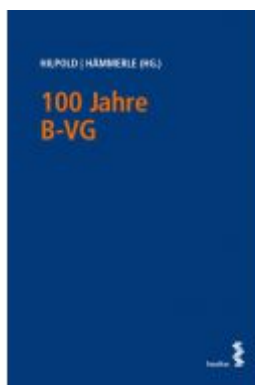
100 Jahre B-VG Ladenpreis: 25,00 EUR