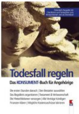
Todesfall regeln. Das KONSUMENT-Buch für Angehörige Ladenpreis: 19,90 EUR