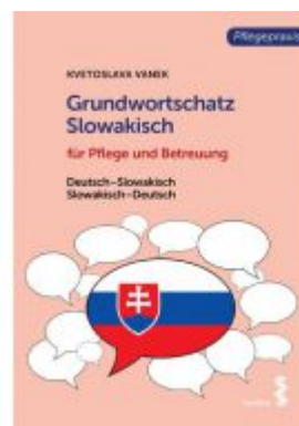
Grundwortschatz Slowakisch für Pflege- und Gesundheitsberufe Ladenpreis: 18,90 EUR