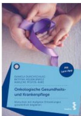
Onkologische Gesundheits- und Krankenpflege Ladenpreis: 24,90 EUR