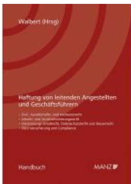
Haftung von leitenden Angestellten und Geschäftsführern Ladenpreis: 98,00 EUR