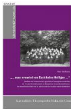
"... man erwartet von Euch keine Heiligen ..." Ladenpreis: 39,90 EUR