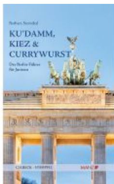
Ku`damm, Kiez und Currywurst Der Berlin-Führer für Juristen Ladenpreis: 26,00 EUR