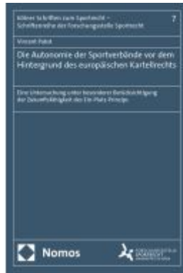
Die Autonomie der Sportverbände vor dem Hintergrund des europäischen Kartellrechts Ladenpreis: 142,90EUR