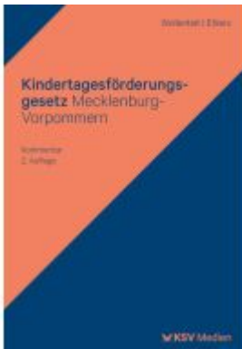
Kindertagesförderungsgesetz Mecklenburg-Vorpommern Ladenpreis: 51,40EUR