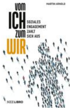
Vom Ich zum Wir Ladenpreis: 28,80EUR