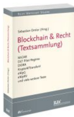
Blockchain & Recht (Textsammlung) Ladenpreis: 40,10EUR