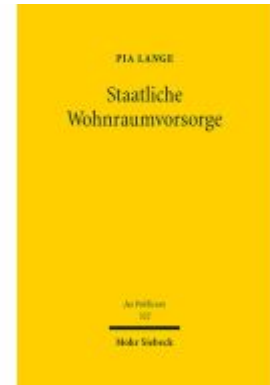
Staatliche Wohnraumvorsorge Ladenpreis: 127,50EUR