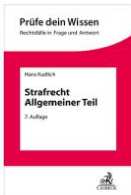
Strafrecht Allgemeiner Teil Ladenpreis: 30,70EUR