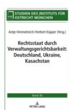
Rechtsstaat durch Verwaltungsgerichtsbarkeit: Deutschland, Ukraine, Kasachstan Ladenpreis: 56,50EUR