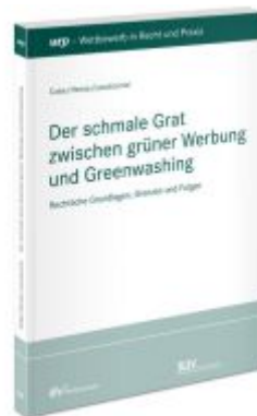
Der schmale Grat zwischen grüner Werbung und Greenwashing Ladenpreis: 71,00EUR