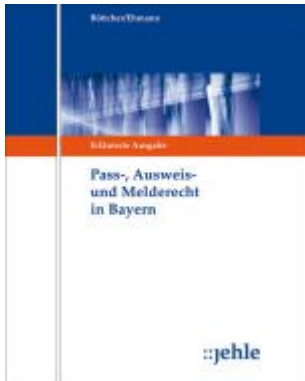
Pass-, Ausweis- und Melderecht in Bayern Ladenpreis: 427,70EUR

Wir haben andere Produkte gefunden, die Ihnen gefallen könnten!