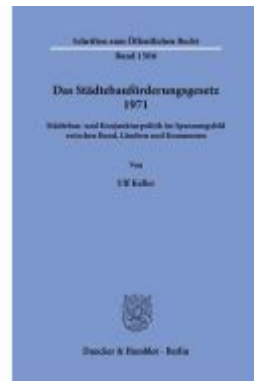
Das Städtebauförderungsgesetz 1971. Ladenpreis: 113,00EUR