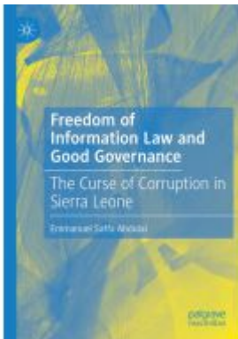
Freedom of Information Law and Good Governance Ladenpreis: 164,99EUR