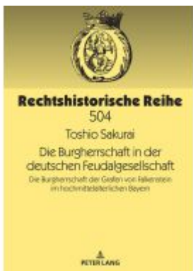
Die Burgherrschaft in der deutschen Feudalgesellschaft Ladenpreis: 46,20EUR