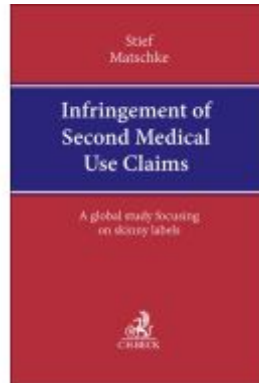
Infringement of Second Medical Use Claims Ladenpreis: 173,80EUR