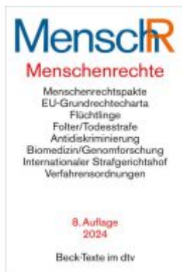
Menschenrechte - Ihr Internationaler Schutz Ladenpreis: 33,90EUR