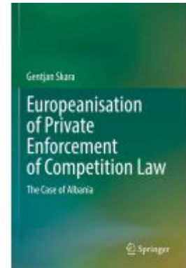
Europeanisation of Private Enforcement of Competition Law Ladenpreis: 142,99EUR