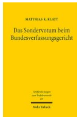
Das Sondervotum beim Bundesverfassungsgericht Ladenpreis: 81,30EUR