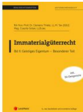
Immateriälgüterrecht (Skriptum) - Bd II Ladenpreis: 36,50EUR