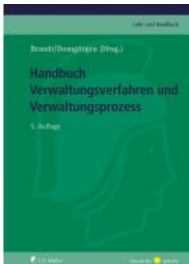
Handbuch Verwaltungsverfahren und Verwaltungsprozess Ladenpreis: 226,20EUR

Wir haben andere Produkte gefunden, die Ihnen gefallen könnten!