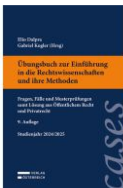
Übungsbuch zur Einführung in die Rechtswissenschaften und ihre Methoden Ladenpreis: 28,00EUR