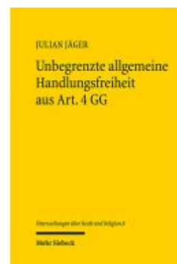
Unbegrenzte allgemeine Handlungsfreiheit aus Art. 4 GG Ladenpreis: 91,50EUR