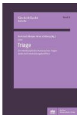
Triage Ladenpreis: 37,10EUR