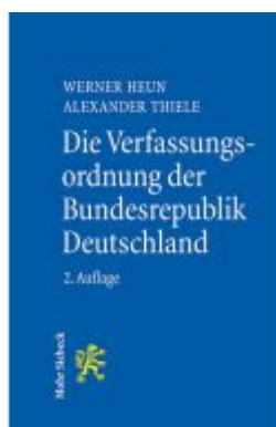
Die Verfassungsordnung der Bundesrepublik Deutschland Ladenpreis: 40,10EUR