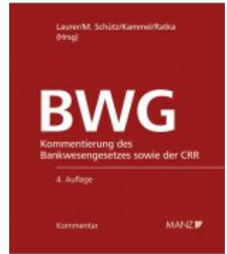
Bankwesengesetz - BWG 4.Auflage Ladenpreis: 378,00 EUR