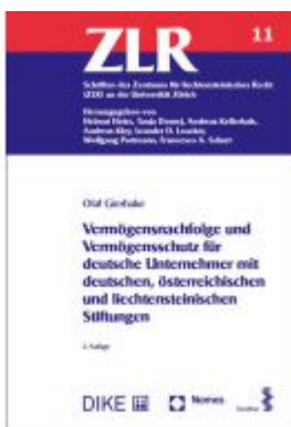
Vermögensnachfolge und Vermögensschutz für deutsche Unternehmer mit deutschen, österreichischen und liechtensteinischen Stiftungen Ladenpreis: 88,40 EUR