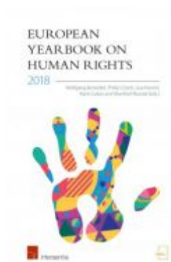
European Yearbook on Human Rights 2018 Ladenpreis: 75,00 EUR