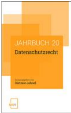
Datenschutzrecht Ladenpreis: 62,00 EUR