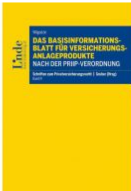
Das Basisinformationsblatt für Versicherungsanlageprodukte nach der PRIIP-Verordnung Ladenpreis: 48,00 EUR