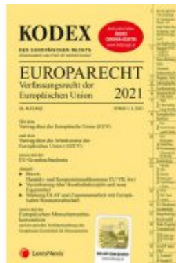
KODEX EU-Verfassungsrecht (Europarecht) 2021 Ladenpreis: 37,50 EUR