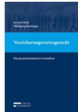
Versicherungsvertragsrecht Ladenpreis: 89,00 EUR