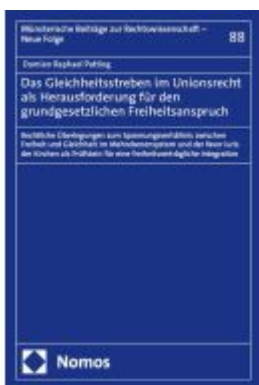
Das Gleichheitsstreben im Unionsrecht als Herausforderung für den grundgesetzlichen Freiheitsanspruch Ladenpreis: 137,80EUR