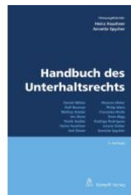
Handbuch des Unterhaltsrechts Ladenpreis: 304,60EUR