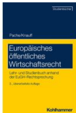
Europäisches öffentliches Wirtschaftsrecht