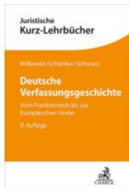
Deutsche Verfassungsgeschichte Ladenpreis: 33,90EUR