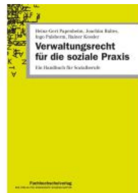
Verwaltungsrecht für die soziale Praxis Ladenpreis: 29,90EUR