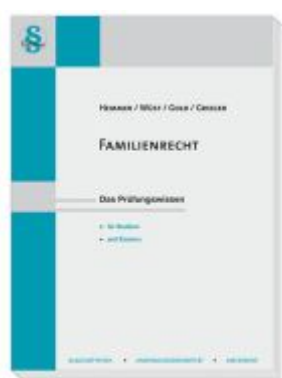
Familienrecht Ladenpreis: 23,60EUR