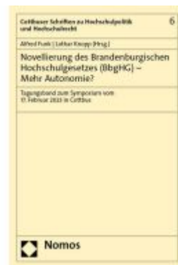
Novellierung des Brandenburgischen Hochschulgesetzes (BbgHG) – Mehr Autonomie?