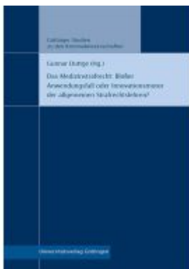
Das Medizinstrafrecht: Bloßer Anwendungsfall oder Innovationsmotor der allgemeinen Strafrechtslehren?