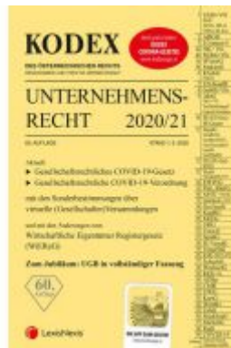
KODEX Unternehmensrecht 2020/21 Ladenpreis: 37,50 EUR