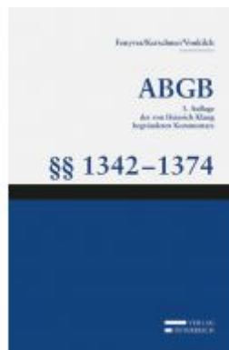
Großkommentar zum ABGB - Klang Kommentar Ladenpreis: 185,00 EUR