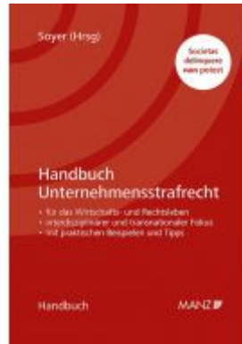
Handbuch Unternehmensstrafrecht Ladenpreis: 118,00 EUR