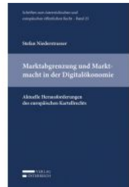
Marktabgrenzung und Marktmacht in der Digitalökonomie Ladenpreis: 49,00 EUR