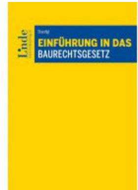
Einführung in das Baurechtsgesetz Ladenpreis: 24,00 EUR