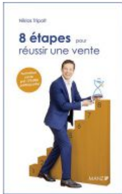
8 étapes pour réussir une vente Ladenpreis: 28,90 EUR