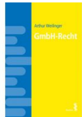
GmbH-Recht Ladenpreis: 18,00 EUR