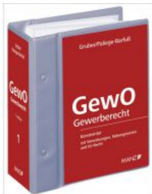
Gewerbeordnung Ladenpreis: 498,00 EUR