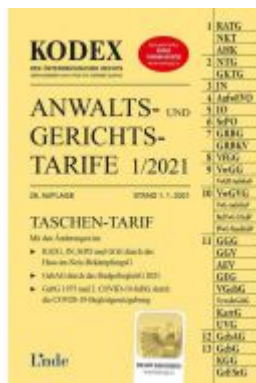
KODEX Anwalts- und Gerichtstarife 1/2021 Ladenpreis: 29,50 EUR