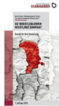
EU-Whistleblower-Richtlinie kompakt Ladenpreis: 29,70 EUR