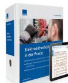
Elektrosicherheit in der Praxis Ladenpreis: 261,45 EUR