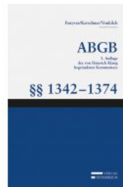
Großkommentar zum ABGB - Klang Kommentar Aktionspreis: 157,25 EUR Ladenpreis: 185,00 EUR