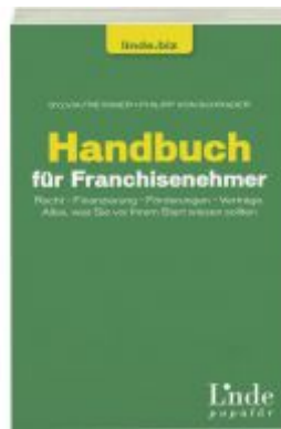
Handbuch für Franchisenehmer Ladenpreis: 19,90 EUR