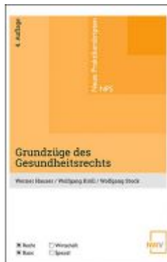
Grundzüge des Gesundheitsrechts Ladenpreis: 24,00 EUR