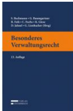
Besonderes Verwaltungsrecht Ladenpreis: 55,00 EUR