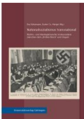
Nationalsozialismus transnational Ladenpreis: 50,40EUR