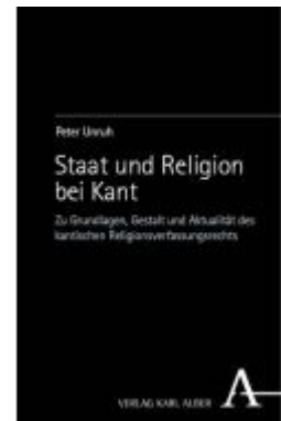
Staat und Religion bei Kant Ladenpreis: 101,80EUR