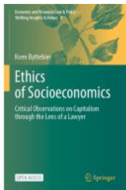
Ethics of Socioeconomics Ladenpreis: 43,99EUR