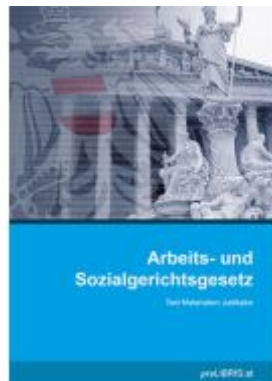
Arbeits- und Sozialgerichtsgesetz Ladenpreis: 26,00EUR