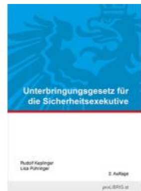
Unterbringungsgesetz für die Sicherheitsexekutive Ladenpreis: 10,00EUR