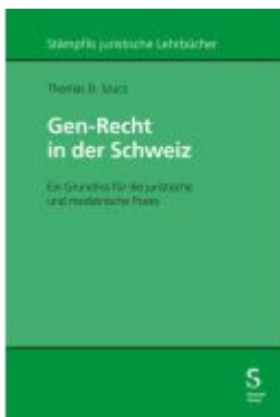
Gen-Recht in der Schweiz Ladenpreis: 292,70EUR