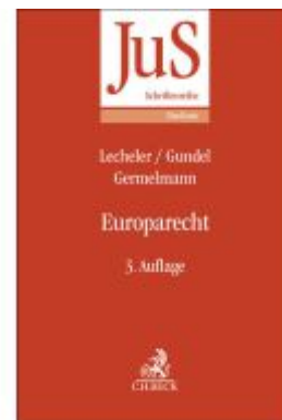
Europarecht Ladenpreis: 30,70EUR