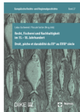
Recht, Fischerei und Nachhaltigkeit im 15.-18. Jahrhundert Ladenpreis: 72,00EUR