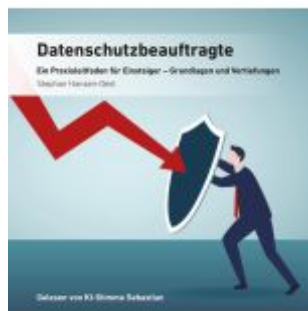
Datenschutzbeauftragte Ladenpreis: 40,10EUR