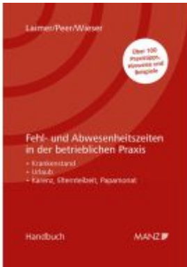
Fehl- und Abwesenheitszeiten in der betrieblichen Praxis Ladenpreis: 52,00EUR