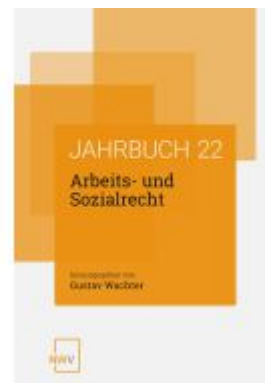
Arbeits- und Sozialrecht Ladenpreis: 64,00EUR