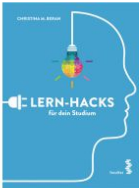
Lern-Hacks für dein Studium Ladenpreis: 14,90EUR