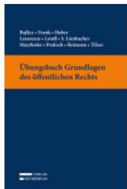
Übungsbuch Grundlagen des öffentlichen Rechts Ladenpreis: 19,00EUR