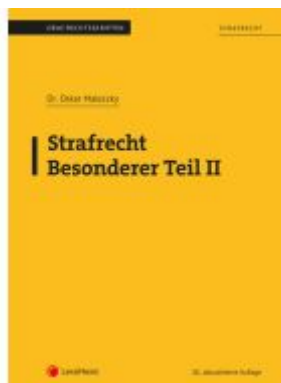
Strafrecht - Besonderer Teil II (Skriptum) Ladenpreis: 25,00EUR