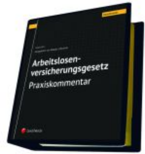
Arbeitslosenversicherungsgesetz - Praxiskommentar Ladenpreis: 290,00EUR