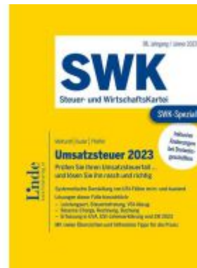
SWK-Spezial Umsatzsteuer 2023 Ladenpreis: 53,00EUR