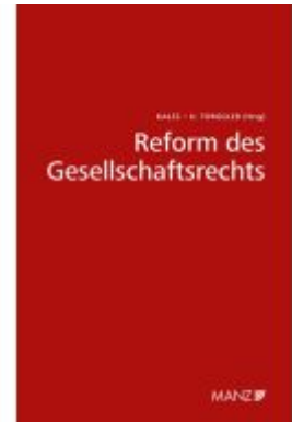
Reform des Gesellschaftsrechts Ladenpreis: 48,00EUR