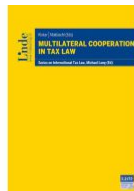
Multilateral Cooperation in Tax Law Ladenpreis: 98,00EUR