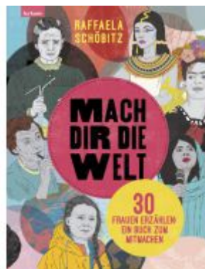
Mach dir die Welt Ladenpreis: 25,50EUR