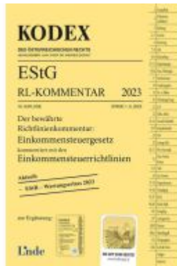
KODEX ESiG Richtlinien-Kommentar 2023 Ladenpreis: 72,00EUR