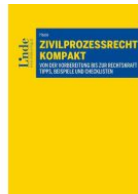
Zivilprozessrecht kompakt Ladenpreis: 30,00EUR