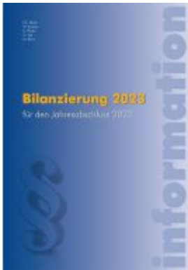
Bilanzierung 2023 Ladenpreis: 49,50EUR