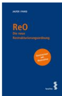
ReO Ladenpreis: 38,00EUR