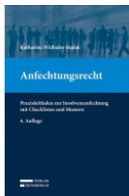
Anfechtungsrecht Ladenpreis: 49,00EUR