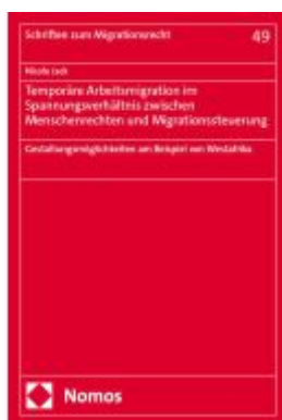
Temporäre Arbeitsmigration im Spannungsverhältnis zwischen Menschenrechten und Migrationssteuerung Ladenpreis: 184,10EUR