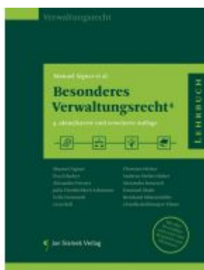
SET Fallbuch Öffentliches Recht und Besonderes Verwaltungsrecht 4. Auflage Ladenpreis: 78,00EUR