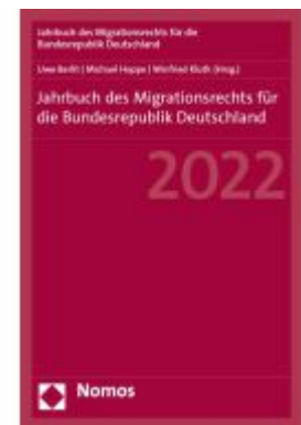
Jahrbuch des Migrationsrechts für die Bundesrepublik Deutschland 2022 Ladenpreis: 101,80EUR