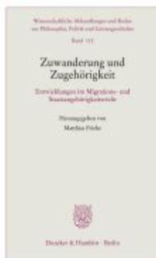
Zuwanderung und Zugehörigkeit Ladenpreis: 61,60EUR