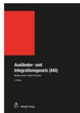
Ausländer- und Integrationsgesetz (AIG) Ladenpreis: 539,60EUR