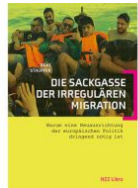
Die Sackgasse der irregulären Migration Ladenpreis: 28,80EUR