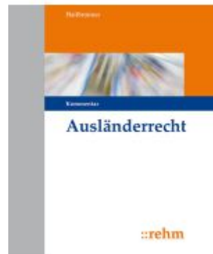
Ausländerrecht Ladenpreis: 410,20EUR