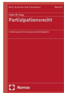
Partizipationsrecht Ladenpreis: 235,50EUR