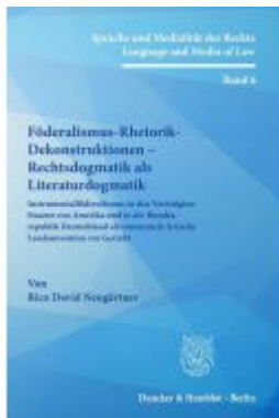
Föderalismus-Rhetorik-Dekonstruktionen – Rechtsdogmatik als Literaturdogmatik. Ladenpreis: 154,10EUR

Wir haben andere Produkte gefunden, die Ihnen gefallen könnten!