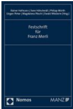
Festschrift für Franz Merli Ladenpreis: 225,20EUR