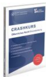
CRASHKURS Öffentliches Recht - Brandenburg Ladenpreis: 27,70EUR