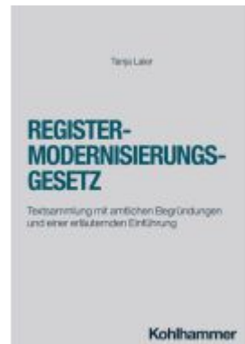
Registermodernisierungsgesetz Ladenpreis: 32,90EUR