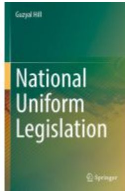
National Uniform Legislation Ladenpreis: 153,99EUR