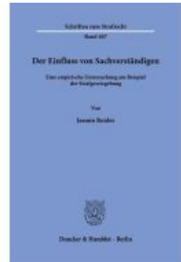
Der Einfluss von Sachverständigen. Ladenpreis: 92,50EUR