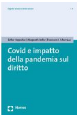
Covid e impatto della pandemia sul diritto Ladenpreis: 60,70EUR