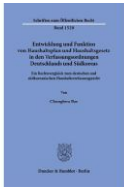
Entwicklung und Funktion von Haushaltsplan und Haushaltsgesetz in den Verfassungsordnungen Deutschlands und Südkoreas. Ladenpreis: 82,20EUR