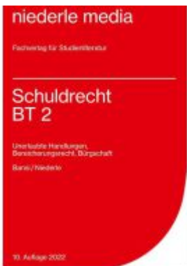
Schuldrecht BT 2 - 2022 Ladenpreis: 12,30EUR