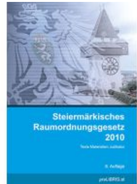
Steiermärkisches Raumordnungsgesetz 2010 Ladenpreis: 28,00EUR