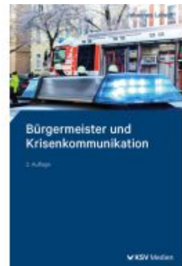
Bürgermeister und Krisenkommunikation Ladenpreis: 25,70EUR