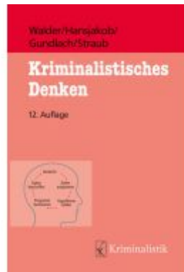
Kriminalistisches Denken Ladenpreis: 30,90EUR