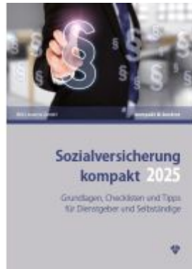
Sozialversicherung kompakt 2025 Ladenpreis: 31,90EUR