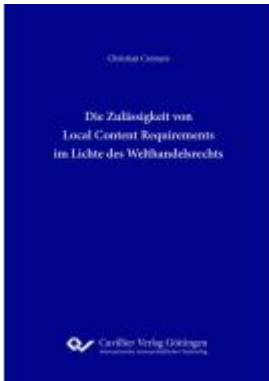
Die Zulässigkeit von Local Content Requirements im Lichte des Welthandelsrechts Ladenpreis: 92,40EUR

Wir haben andere Produkte gefunden, die Ihnen gefallen könnten!