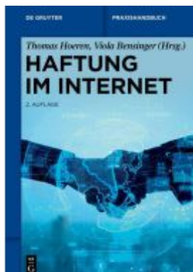
Haftung im Internet Ladenpreis: 129,95EUR