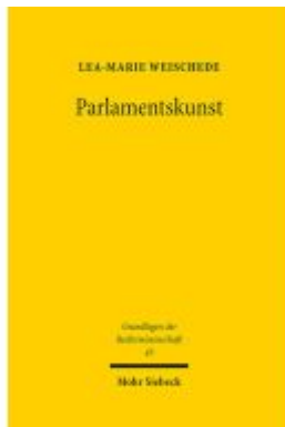
Parlamentskunst Ladenpreis: 101,80EUR