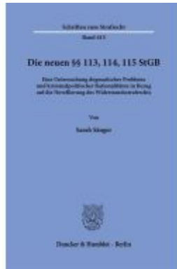
Die neuen §§ 113, 114, 115 StGB. Ladenpreis: 82,20EUR