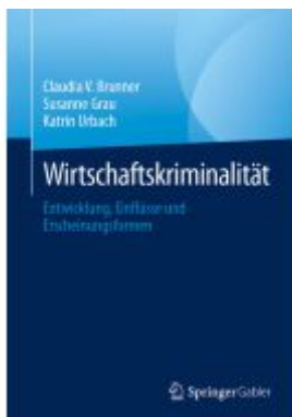
Wirtschaftskriminalität Ladenpreis: 46,25EUR