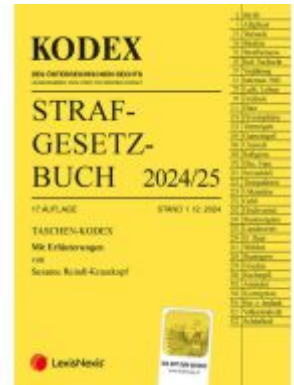
Taschen-Kodex Strafgesetzbuch 2025 - inkl. App Ladenpreis: 18,00EUR