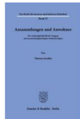
Ansammlungen und Anwohner. Ladenpreis: 102,70EUR