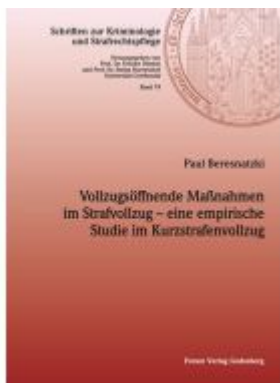
Vollzugsöffnende Maßnahmen im Strafvollzug – eine empirische Studie im Kurzstrafenvollzug Ladenpreis: 45,30EUR