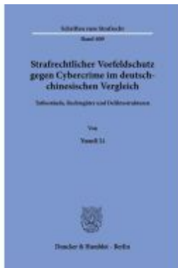
Strafrechtlicher Vorfeldschutz gegen Cybercrime im deutsch-chinesischen Vergleich. Ladenpreis: 92,50EUR