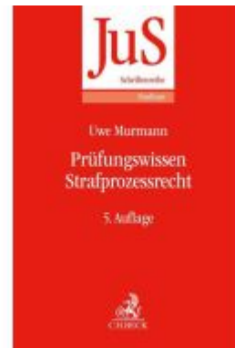
Prüfungswissen Strafrecht Ladenpreis: 24,60EUR