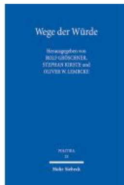
Wege der Würde Ladenpreis: 50,40EUR