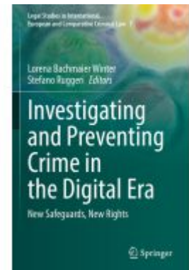
Investigating and Preventing Crime in the Digital Era Ladenpreis: 109,99EUR