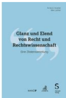
Glanz und Elend von Recht und Rechtswissenschaft Ladenpreis: 41,20EUR