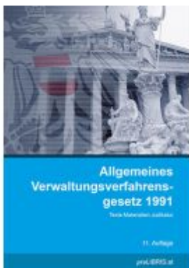
Allgemeines Verwaltungsverfahrensgesetz 1991 Ladenpreis: 33,00EUR