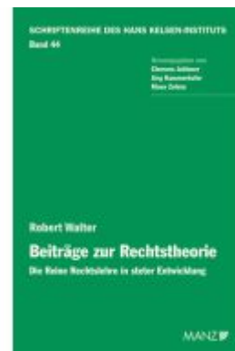
Robert Walter. Beiträge zur Rechtstheorie Ladenpreis: 68,00EUR