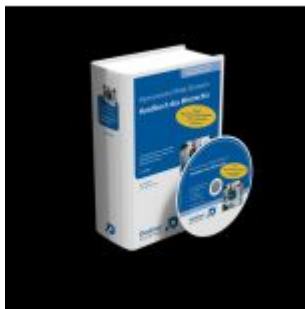
Handbuch des Mietrechts Ladenpreis: 250,80EUR