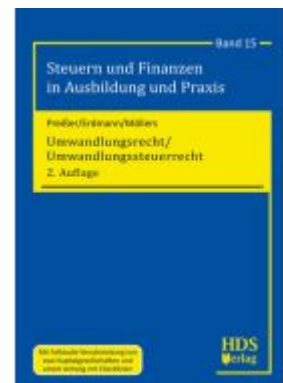
Umwandlungsrecht/Umwandlungssteuerrecht Ladenpreis: 61,60EUR