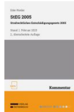
StEG 2005 Strafrechtliches Entschädigungsgesetz 2005 Ladenpreis: 58,00EUR