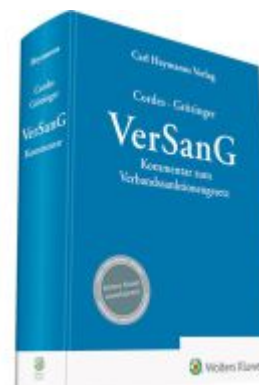
VerSanG Ladenpreis: 132,70EUR