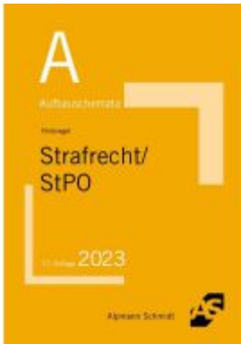
Aufbauschemata Strafrecht / StPO Ladenpreis: 19,50EUR