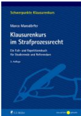
Klausurenkurs im Strafprozessrecht Ladenpreis: 24,70EUR