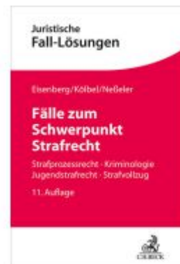
Fälle zum Schwerpunkt Strafrecht Ladenpreis: 40,00EUR