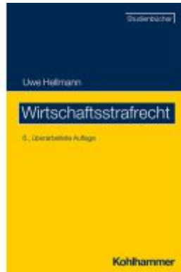
Wirtschaftsstrafrecht Ladenpreis: 38,00EUR