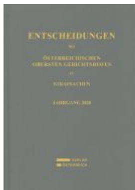
Entscheidungen des Österreichischen Obersten Gerichtshofes in Strafsachen Ladenpreis: 128,00EUR