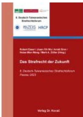
Das Strafrecht der Zukunft Ladenpreis: 91,40EUR

Wir haben andere Produkte gefunden, die Ihnen gefallen könnten!