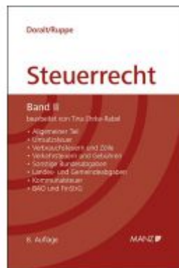
Grundriss des österreichischen Steuerrechts Ladenpreis: 68,00 EUR