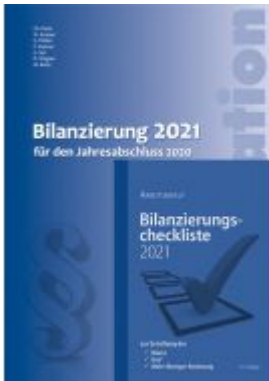
Kombi-Paket Bilanzierung 2021 Ladenpreis: 49,80 EUR