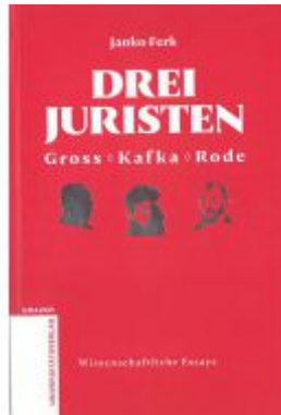
Drei Juristen - Gross - Kafka - Rode Ladenpreis: 12,90 EUR