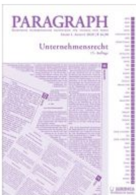
Paragraph - Unternehmensrecht Ladenpreis: 16,90 EUR