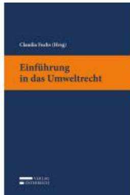
Einführung in das Umweltrecht Ladenpreis: 28,00 EUR