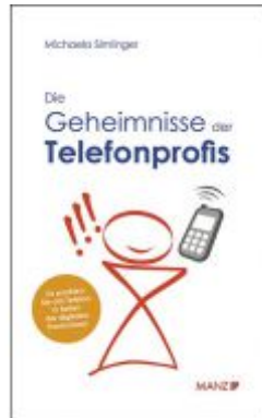
Die Geheimnisse des Telefonprofis Ladenpreis: 21,90 EUR