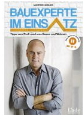
Bauexperte im Einsatz Ladenpreis: 14,90 EUR