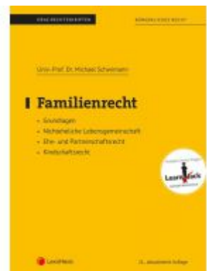
Familienrecht (Skriptum) Ladenpreis: 19,00 EUR