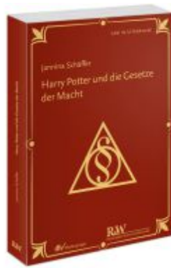
Harry Potter und die Gesetze der Macht Ladenpreis: 50,40EUR