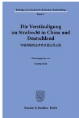
Die Verständigung im Strafrecht in China und Deutschland. Ladenpreis: 71,90EUR