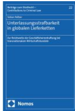
Unterlassungsstrafbarkeit in globalen Lieferketten Ladenpreis: 86,40EUR