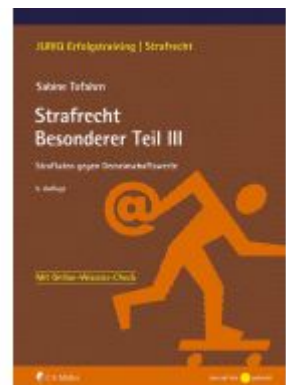
Strafrecht Besonderer Teil III Ladenpreis: 22,70EUR