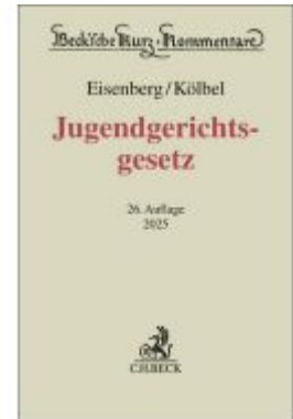
Jugendgerichtsgesetz Ladenpreis: 138,80EUR