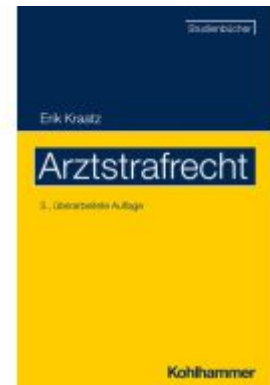
Arztstrafrecht Ladenpreis: 37,00EUR