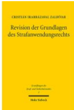
Revision der Grundlagen des Strafanwendungsrechts Ladenpreis: 107,00EUR