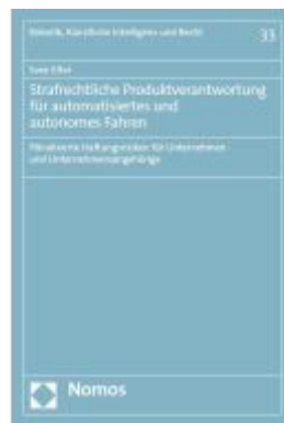
Strafrechtliche Produktverantwortung für automatisiertes und autonomes Fahren Ladenpreis: 101,80EUR