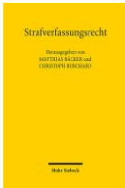
Strafverfassungsrecht Ladenpreis: 86,40EUR