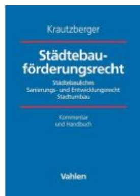
Städtebauförderungsrecht Ladenpreis: 122,40EUR