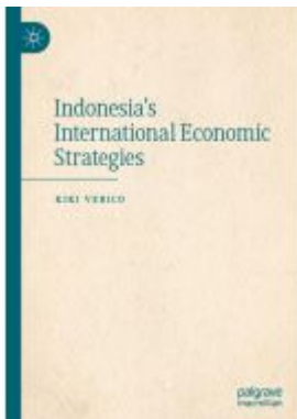
Indonesia's International Economic Strategies Ladenpreis: 142,99EUR