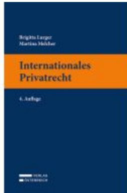
Internationales Privatrecht Ladenpreis: 29,00EUR