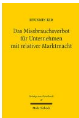
Das Missbrauchsverbot für Unternehmen mit relativer Marktmacht Ladenpreis: 81,30EUR