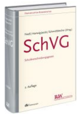
SchVG Ladenpreis: 153,20EUR