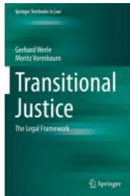
Transitional Justice Ladenpreis: 54,99EUR