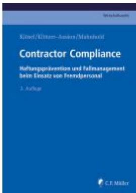
Contractor Compliance Ladenpreis: 76,10EUR