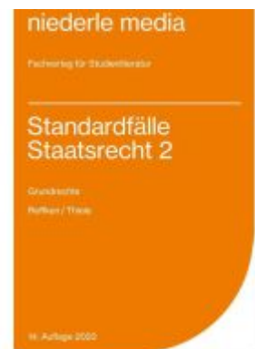
Standardfälle Staatsrecht 2 - Grundrechte - 2022 Ladenpreis: 13,30EUR