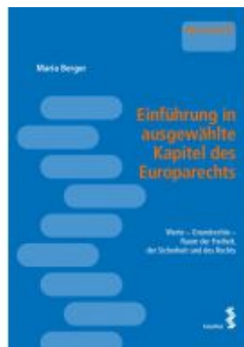
Einführung in ausgewählte Kapitel des Europarechts Ladenpreis: 16,00 EUR