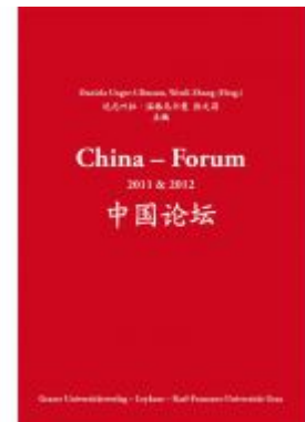
China - Forum Ladenpreis: 14,90 EUR