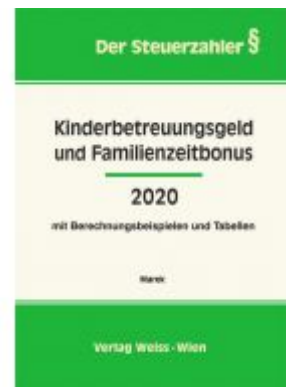
Kinderbetreuungsgeld und Familienzeitbonus 2020 Ladenpreis: 33,00 EUR