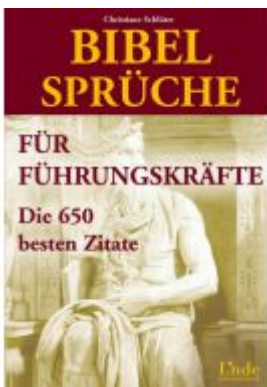
Bibelsprüche für Führungskräfte Ladenpreis: 18,50 EUR