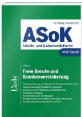
ASoK-Spezial Freie Berufe und Krankenversicherung Ladenpreis: 24,00 EUR