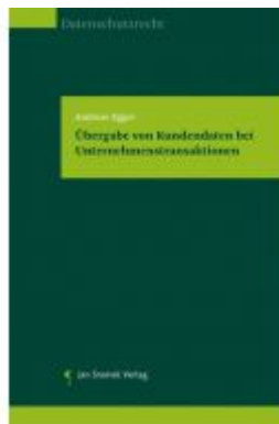
Übergabe von Kundendaten bei Unternehmenstransaktionen Ladenpreis: 37,50 EUR