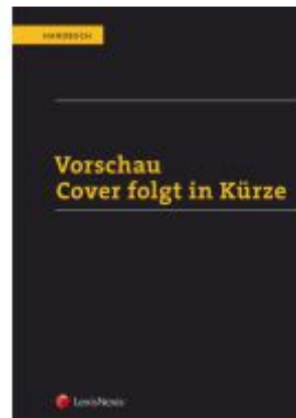
Handbuch Pharmarecht Aktionspreis: 79,00 EUR Ladenpreis: 89,00 EUR