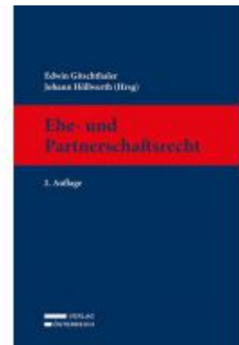
Ehe- und Partnerschaftsrecht Ladenpreis: 299,00 EUR