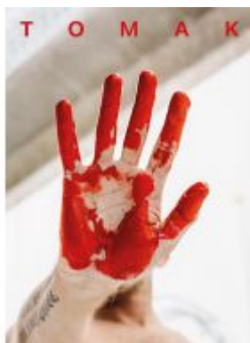
TOMAK Ladenpreis: 48,00 EUR