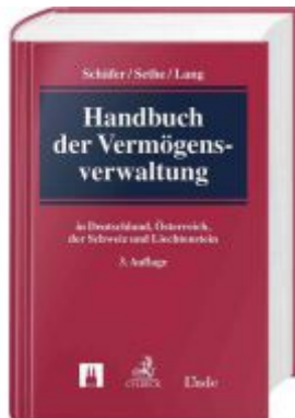
Handbuch der Vermögensverwaltung Ladenpreis: 249,00 EUR