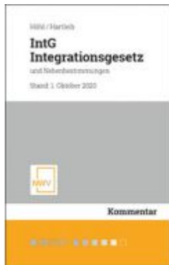
IntG Integrationsgesetz Ladenpreis: 68,00 EUR