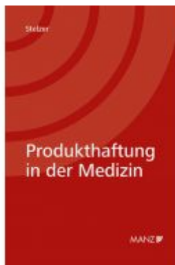
Produkthaftung in der Medizin Ladenpreis: 38,00 EUR