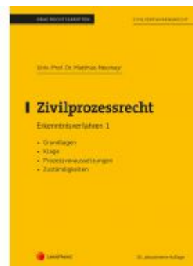
Zivilprozessrecht Erkenntnisverfahren 1 (Skriptum) Ladenpreis: 20,00 EUR