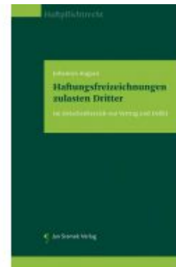
Haftungsfreizeichnungen zulasten Dritter Ladenpreis: 78,00 EUR