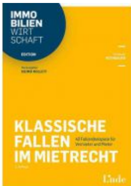
Klassische Fallen im Mietrecht Ladenpreis: 38,00 EUR

Wir haben andere Produkte gefunden, die Ihnen gefallen könnten!