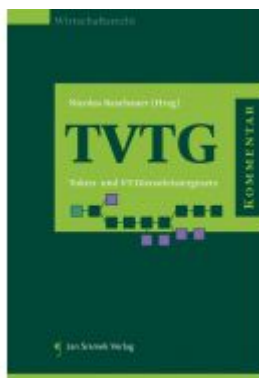
Kommentar zum TVTG Ladenpreis: 148,00 EUR