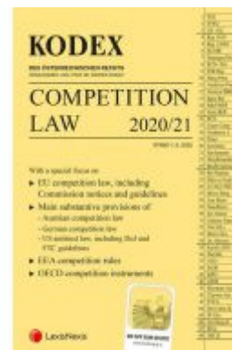
KODEX Competition Law Ladenpreis: 46,00 EUR