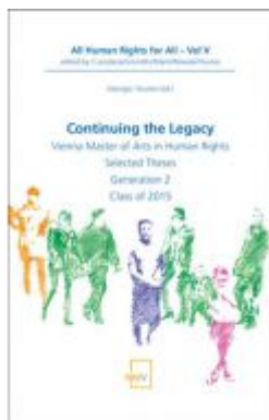
Continuing the Legacy Ladenpreis: 58,00 EUR