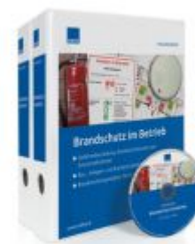
Brandschutz im Betrieb Ladenpreis: 217,80 EUR