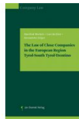
The Law of Close Companies in the European Region Tyrol-South Tyrol-Trentino Ladenpreis: 39,90 EUR