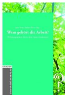
Wem gehört die Arbeit? Ladenpreis: 18,90 EUR