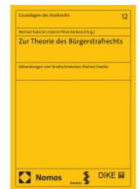
Zur Theorie des Bürgerstrafrechts Ladenpreis: 101,80EUR