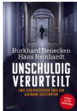
Unschuldig verurteilt Ladenpreis: 24,00EUR