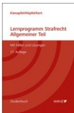
Lernprogramm Strafrecht Allgemeiner Teil Ladenpreis: 54,50EUR