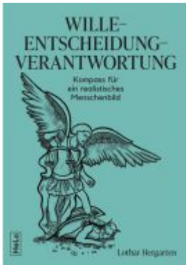
Wille-Entscheidung-Verantwortung Ladenpreis: 19,99EUR