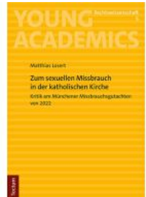
Zum sexuellen Missbrauch in der katholischen Kirche Ladenpreis: 24,70EUR