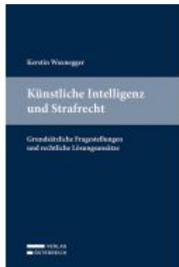
Künstliche Intelligenz und Strafrecht Ladenpreis: 89,00EUR

Wir haben andere Produkte gefunden, die Ihnen gefallen könnten!