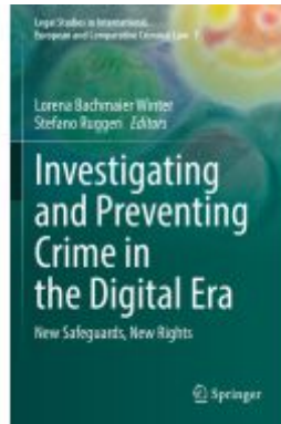
Investigating and Preventing Crime in the Digital Era Ladenpreis: 120,99EUR