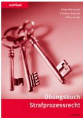
Übungsbuch Strafprozessrecht Ladenpreis: 35,00EUR