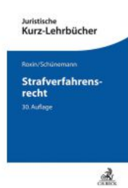
Strafrechtslehre Ladenpreis: 33,90EUR