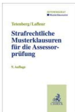
Strafrechtliche Musterklausuren für die Assessorprüfung Ladenpreis: 30,70EUR