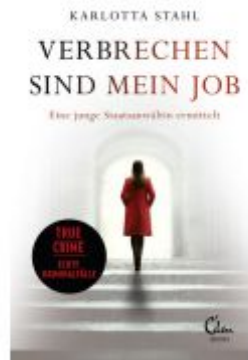
Verbrechen sind mein Job Ladenpreis: 18,50EUR