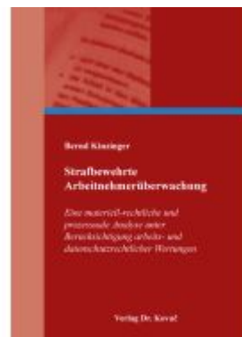
Strafbewehrte Arbeitnehmerüberwachung Ladenpreis: 102,60EUR