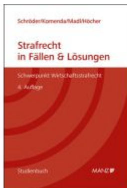
Strafrecht in Fällen & Lösungen Schwerpunkt Wirtschaftsstrafrecht Ladenpreis: 36,80EUR