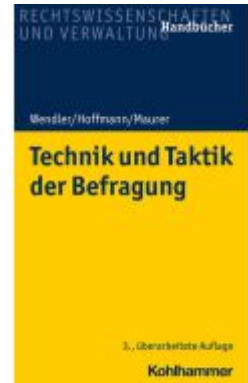
Technik und Taktik der Befragung Ladenpreis: 40,10EUR