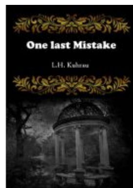
One last mistake Ladenpreis: 15,99EUR