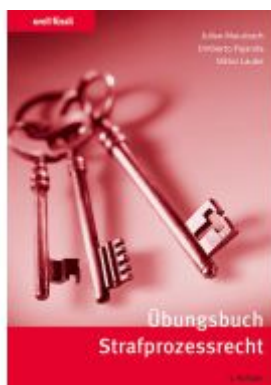
Übungsbuch Strafprozessrecht Ladenpreis: 35,00EUR