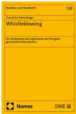
Whistleblowing Ladenpreis: 76,10EUR