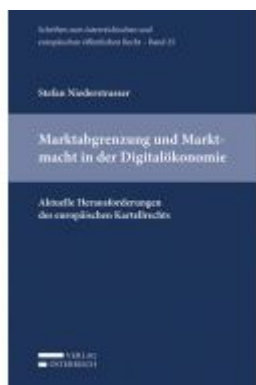
Marktabgrenzung und Marktmacht in der Digitalökonomie Ladenpreis: 49,00 EUR