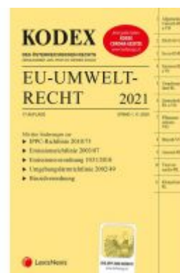
KODEX EU-Umweltrecht 2021 Ladenpreis: 103,00 EUR