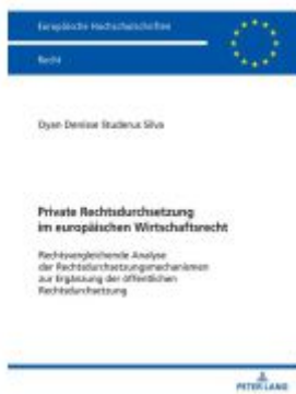
Private Rechtsdurchsetzung im europäischen Wirtschaftsrecht Ladenpreis: 61,60EUR