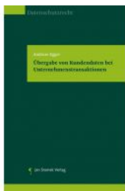
Übergabe von Kundendaten bei Unternehmenstransaktionen Ladenpreis: 37,50 EUR