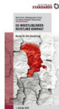
EU-Whistleblower-Richtlinie kompakt Ladenpreis: 29,70 EUR