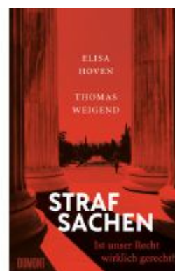
Strafsachen Ladenpreis: 23,70EUR