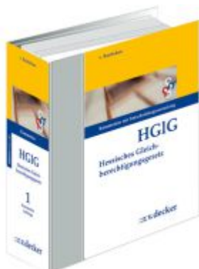
Hessisches Gleichberechtigungsgesetz - HGIG Ladenpreis: 552,10EUR