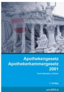
Apothekengesetz / Apothekerkammergesetz 2001 Ladenpreis: 34,00EUR