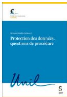
Protection des données : questions de procédure Ladenpreis: 111,80EUR