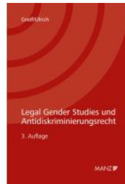
Legal Gender Studies und Antidiskriminierungsrecht Ladenpreis: 52,00EUR