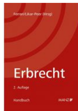
Erbrecht Ladenpreis: 160,00 EUR