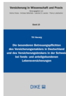
Die besonderen Betreuungspflichten des Versicherungsmaklers in Deutschland und des Versicherungsbrokers in der Schweiz bei fonds- und anteilgebundenen Lebensversicherungen Ladenpreis: 104,00EUR