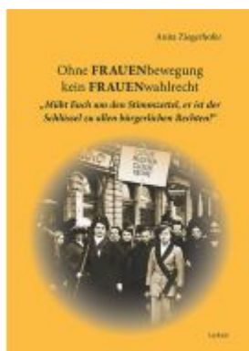
Ohne FRAUENbewegung kein FRAUENwahlrecht Ladenpreis: 17,90 EUR