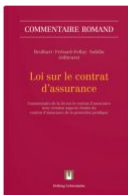
Loi sur le contrat d'assurance Ladenpreis: 416,00EUR