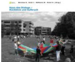
Haus des Dialogs – Rückblick und Aufbruch Ladenpreis: 19,90 EUR

Wir haben andere Produkte gefunden, die Ihnen gefallen könnten!