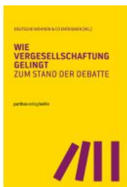
Wie Vergesellschaftung gelingt Ladenpreis: 20,60EUR