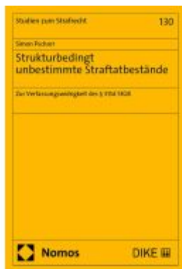
Strukturbedingt unbestimmte Straftatbestände Ladenpreis: 163,50EUR