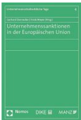
Unternehmenssanktionen in der Europäischen Union Ladenpreis: 65,79EUR

Wir haben andere Produkte gefunden, die Ihnen gefallen könnten!