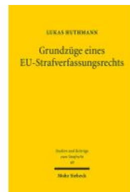
Grundzüge eines EU-Strafverfassungsrechts Ladenpreis: 86,40EUR