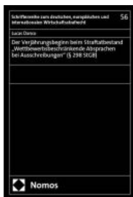
Der Verjährungsbeginn beim Straftatbestand „Wettbewerbsbeschränkende Absprachen bei Ausschreibungen“ (§ 298 StGB) Ladenpreis: 71,00EUR