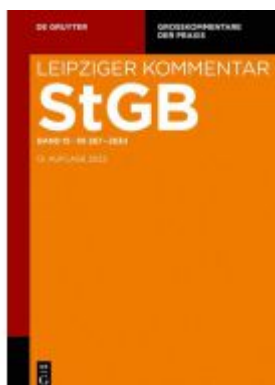
Strafgesetzbuch. Leipziger Kommentar / §§ 267-283d Ladenpreis: 179,00EUR