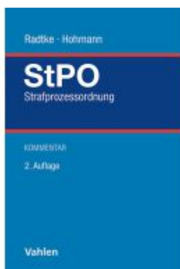
Strafprozessordnung Ladenpreis: 286,90EUR