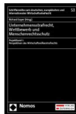
Unternehmensstrafrecht, Wettbewerb und Menschenrechtsschutz Ladenpreis: 256,00EUR