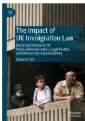
The Impact of UK Immigration Law Ladenpreis: 142,99EUR