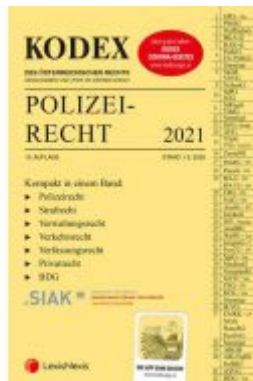
KODEX Polizeirecht 2021 Ladenpreis: 58,00 EUR