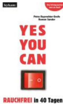
YES YOU CAN. Rauchfrei in 40 Tagen. Ladenpreis: 16,90 EUR