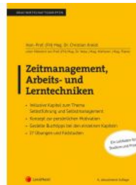
Zeitmanagement, Arbeits- und Lerntechniken Ladenpreis: 28,00 EUR