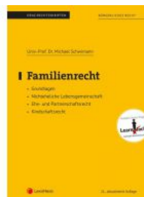
Familienrecht (Skriptum) Ladenpreis: 19,00 EUR