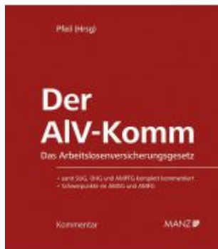
Der AIV-Komm Das Arbeitslosenversicherungsgesetz Ladenpreis: 198,00 EUR