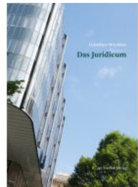
Das Juridicum Ladenpreis: 49,90 EUR