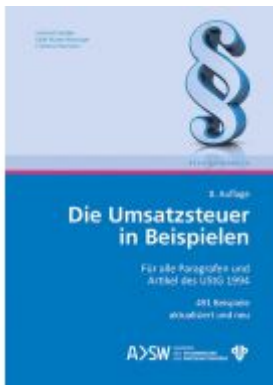
Die Umsatzsteuer in Beispielen Ladenpreis: 59,00 EUR