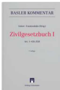
Zivilgesetzbuch I Ladenpreis: 658,00EUR