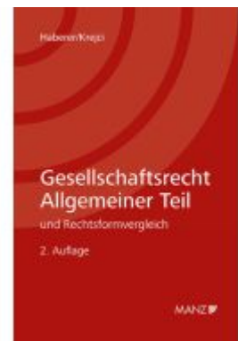
Gesellschaftsrecht Allgemeiner Teil Ladenpreis: 69,00EUR