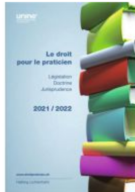
Le droit pour le praticien 2021/2022 Ladenpreis: 87,00EUR