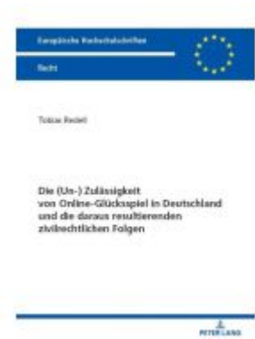
Die (Un-) Zulässigkeit von Online- Glücksspiel in Deutschland und die daraus resultierenden zivilrechtlichen Folgen Ladenpreis: 82,20EUR