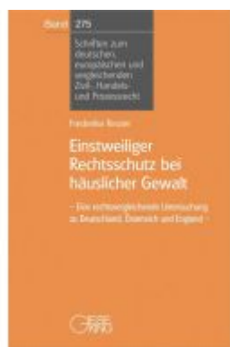
Einstweiliger Rechtsschutz bei häuslicher Gewalt