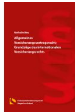
Allgemeines Versicherungsvertragsrecht; Grundzüge des internationalen Versicherungsrechts