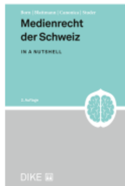
Medienrecht der Schweiz Ladenpreis: 53,00EUR