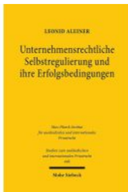
Unternehmensrechtliche Selbstregulierung und ihre Erfolgsbedingungen