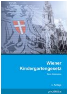
Wiener Kindergartengesetz Ladenpreis: 20,00EUR