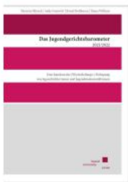
Jugendgerichtsbarometer 2021/2022 Ladenpreis: 24,70EUR

Wir haben andere Produkte gefunden, die Ihnen gefallen könnten!