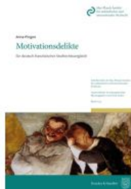
Motivationsdelikte. Ladenpreis: 123,30EUR