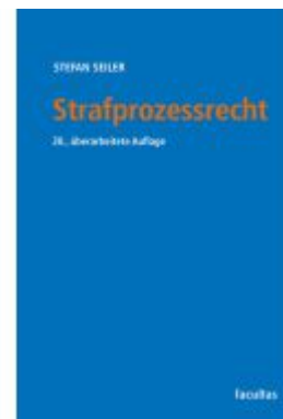
Strafprozessrecht Ladenpreis: 39,00EUR