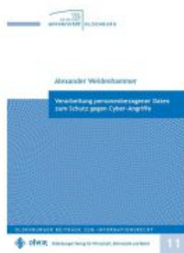
Verarbeitung personenbezogener Daten zum Schutz gegen Cyber-Angriffe Ladenpreis: 41,00EUR