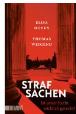
Strafsachen Ladenpreis: 14,40EUR