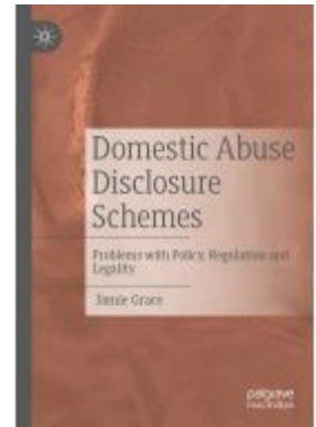
Domestic Abuse Disclosure Schemes Ladenpreis: 131,99EUR