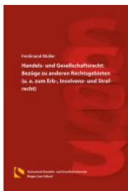
Handels- und Gesellschaftsrecht: Bezüge zu anderen Rechtsgebieten (u. a. zum Erb-, Insolvenz- und Strafrecht) Ladenpreis: 46,30EUR