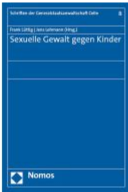
Sexuelle Gewalt gegen Kinder Ladenpreis: 29,90EUR