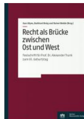
Recht als Brücke zwischen Ost und West Ladenpreis: 84,30EUR