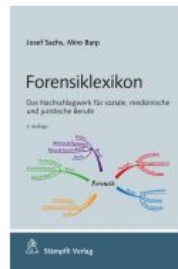
Forensiklexikon Ladenpreis: 51,90EUR