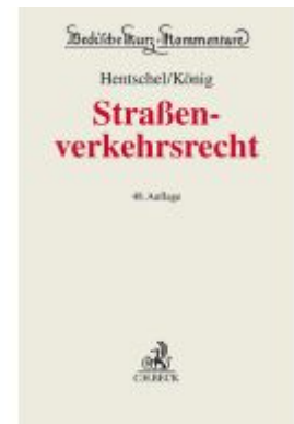
Straßenverkehrsrecht Ladenpreis: 149,10EUR