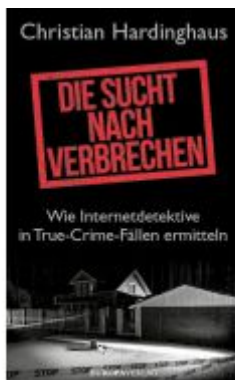
Die Sucht nach Verbrechen Ladenpreis: 22,70EUR