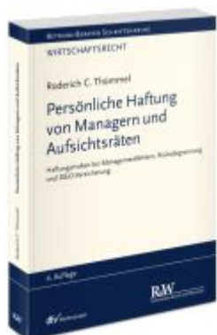
Persönliche Haftung von Managern und Aufsichtsräten Ladenpreis: 132,70EUR

Wir haben andere Produkte gefunden, die Ihnen gefallen könnten!