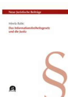
Das Informationsfreiheitsgesetz und die Justiz Ladenpreis: 71,00EUR