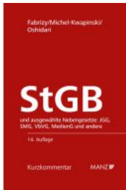
Strafgesetzbuch StGB Ladenpreis: 178,00EUR