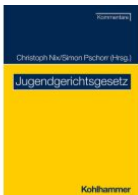
Jugendgerichtsgesetz Ladenpreis: 94,60EUR