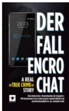
Der Fall EncroChat - A Real »True Crime« Story Ladenpreis: 23,00EUR