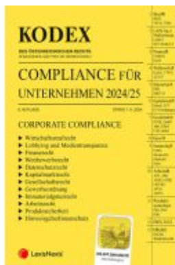
KODEX Compliance für Unternehmen 2024/25 - inkl. App Ladenpreis: 81,00EUR