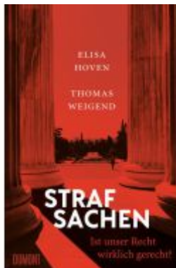
Strafsachen Ladenpreis: 23,70EUR