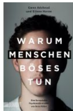
Warum Menschen Böses tun Ladenpreis: 14,40EUR