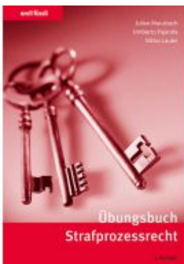
Übungsbuch Strafprozessrecht Ladenpreis: 35,00EUR