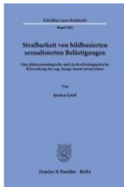
Strafbarkeit von bildbasierten sexualisierten Belästigungen. Ladenpreis: 102,70EUR