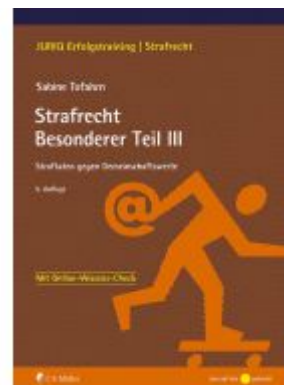
Strafrecht Besonderer Teil III Ladenpreis: 22,70EUR