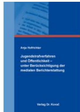
Jugendstrafverfahren und Öffentlichkeit – unter Berücksichtigung der medialen Berichterstattung Ladenpreis: 91,40EUR