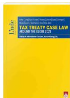
Tax Treaty Case Law around the Globe 2021 Ladenpreis: 90,00EUR