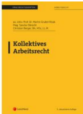
Kollektives Arbeitsrecht (Skriptum) Ladenpreis: 23,75EUR