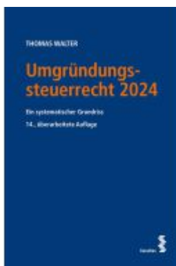
Umgründungssteuerrecht 2024 Ladenpreis: 68,00EUR