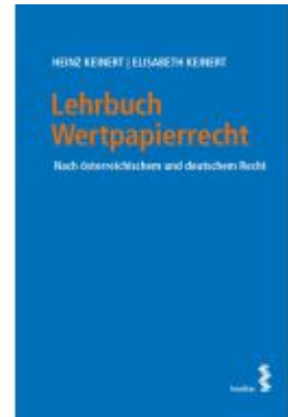
Lehrbuch Wertpapierrecht Ladenpreis: 42,00EUR