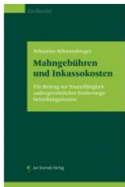
Mahngebühren und Inkassokosten Ladenpreis: 59,90EUR

Wir haben andere Produkte gefunden, die Ihnen gefallen könnten!