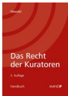
Das Recht der Kuratoren Ladenpreis: 84,00EUR