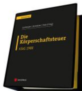
Die Körperschaftsteuer (KStG 1988) Ladenpreis: 450,00EUR