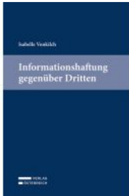
Informationshaftung gegenüber Dritten Ladenpreis: 79,00EUR