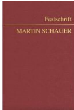
Festschrift Martin Schauer Ladenpreis: 178,00EUR