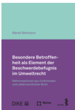
Haupttitel: Besondere Betroffenheit als Element der Beschwerdebefugnis im Umweltrecht Ladenpreis: 117,20EUR