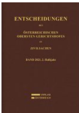
Entscheidungen des Obersten Gerichtshofes in Zivilsachen Ladenpreis: 169,00EUR