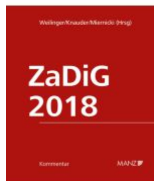
ZaDiG 2018 Ladenpreis: 298,00EUR