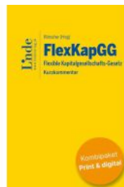
FlexKapGG | Flexible Kapitalgesellschafts-Gesetz (Kombi Print&digital) Ladenpreis: 99,00EUR