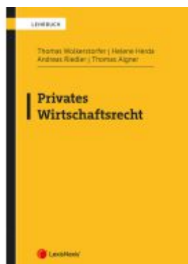
Privates Wirtschaftsrecht Ladenpreis: 42,00EUR