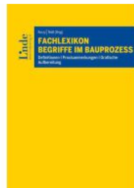
Fachlexikon Begriffe im Bauprozess Ladenpreis: 89,00EUR