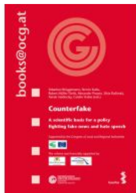
Counterfake Ladenpreis: 36,00EUR