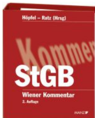
Wiener Kommentar zum Strafgesetzbuch 2.Auflage Ladenpreis: 765,00EUR