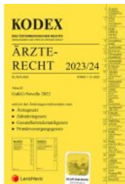
KODEX Ärzterecht 2023/24 - inkl. App Ladenpreis: 99,00EUR

Wir haben andere Produkte gefunden, die Ihnen gefallen könnten!