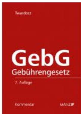
GebG - Kommentar zum Gebührengesetz Ladenpreis: 158,00 EUR