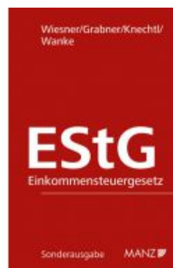
Einkommensteuergesetz EStG Ladenpreis: 398,00 EUR