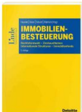
Immobilienbesteuerung Ladenpreis: 68,00 EUR

Wir haben andere Produkte gefunden, die Ihnen gefallen könnten!