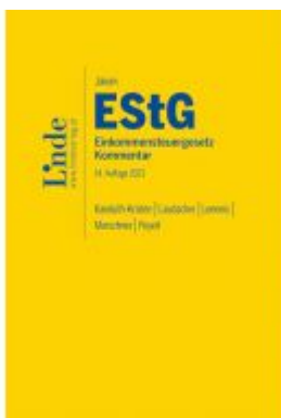
Jakom EStG | Einkommensteuergesetz 2021 Ladenpreis: 140,00 EUR