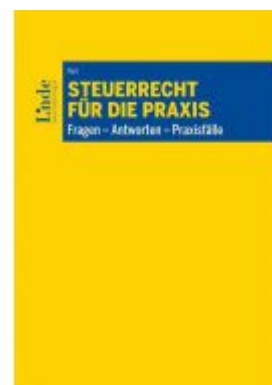
Steuerrecht für die Praxis Ladenpreis: 39,00 EUR