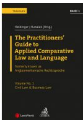
Angloamerikanische Rechtssprache / The Practitioners' Guide to Applied Comparative Law and Language Vol 1 Ladenpreis: 94,00 EUR