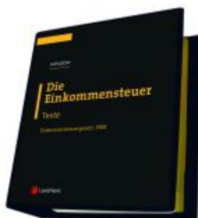
Die Einkommensteuer (EStG 1988) Band I - Texte Ladenpreis: 298,00 EUR