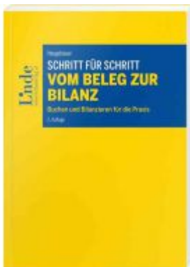
Schritt für Schritt vom Beleg zur Bilanz Ladenpreis: 38,00 EUR