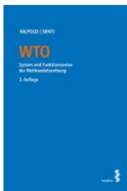
WTO Ladenpreis: 86,00EUR