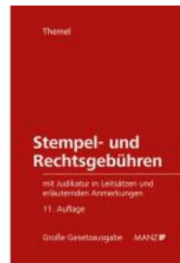
Stempel- und Rechtsgebühren Ladenpreis: 138,00EUR