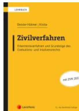
Zivilverfahren Ladenpreis: 69,00EUR