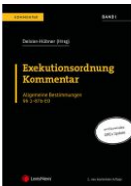
Exekutionsordnung Kommentar - Band I Ladenpreis: 196,00EUR