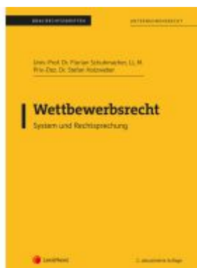
Wettbewerbsrecht (Skriptum) Ladenpreis: 27,50EUR