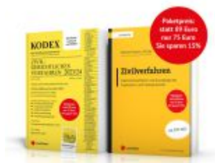
PAKET ZGV - Lehrbuch Zivilverfahren & Kodex ZGV Ladenpreis: 75,00EUR