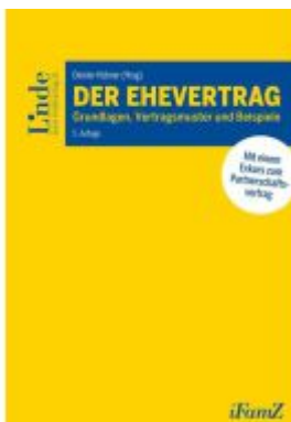
Der Ehevertrag Ladenpreis: 62,00EUR