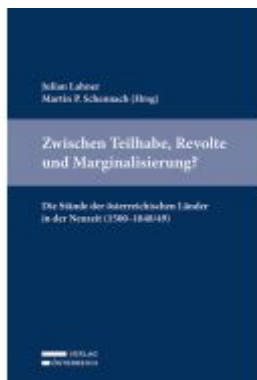
Zwischen Teilhabe, Revolte und Marginalisierung? Die Stände der österreichischen Länder in der Neuzeit (1500–1848/49) Ladenpreis: 59,00EUR