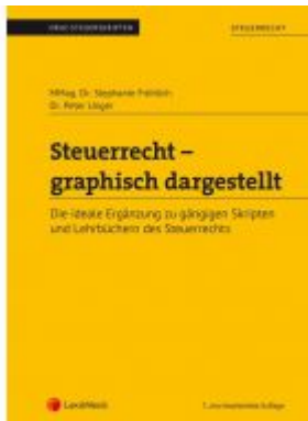
Steuerrecht - graphisch dargestellt (Skriptum) Ladenpreis: 22,00 EUR