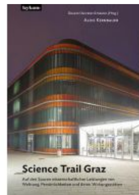
Science Trail Graz Ladenpreis: 28,00 EUR