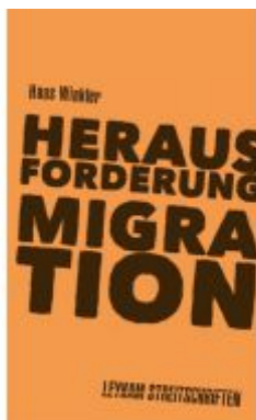
Herausforderung Migration Ladenpreis: 7,50 EUR