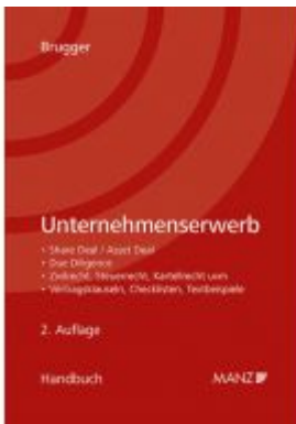
Handbuch Unternehmenserwerb Ladenpreis: 158,00 EUR