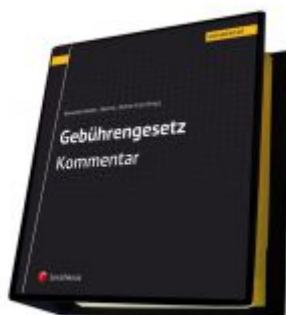
Gebührengesetz Kommentar Ladenpreis: 160,00 EUR