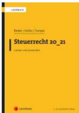
Steuerrecht 20_21 Ladenpreis: 69,00 EUR

Wir haben andere Produkte gefunden, die Ihnen gefallen könnten!