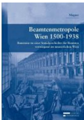
Beamtenmetropole Wien 1500-1938 Ladenpreis: 39,00 EUR