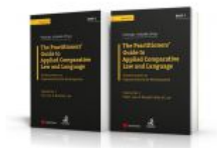
Angloamerikanische Rechtssprache / PAKET: The Practitioners' Guide to Applied Comparative Law and Language Ladenpreis: 142,00 EUR