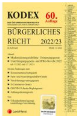
KODEX Bürgerliches Recht 2022/23 - inkl.