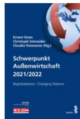
Schwerpunkt Außenwirtschaft 2021/2022 Ladenpreis: 19,80 EUR