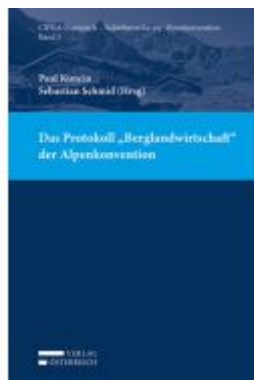
Das Protokoll "Berglandwirtschaft" der Alpenkonvention Ladenpreis: 42,00 EUR