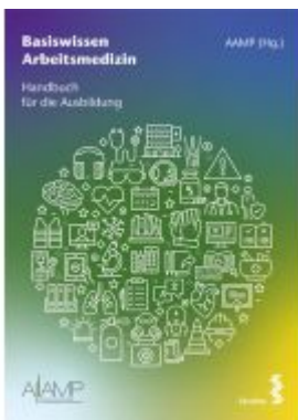
Basiswissen Arbeitsmedizin Ladenpreis: 94,00 EUR

Wir haben andere Produkte gefunden, die Ihnen gefallen könnten!