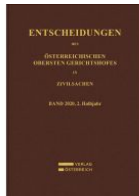
Entscheidungen des Obersten Gerichtshofes in Zivilsachen