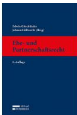
Ehe- und Partnerschaftsrecht Ladenpreis: 299,00 EUR