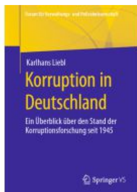
Korruption in Deutschland