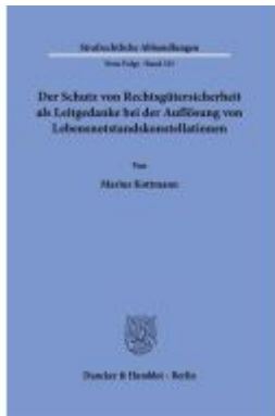
Der Schutz von Rechtsgütersicherheit als Leitgedanke bei der Auflösung von Lebensnotstandskonstellationen Ladenpreis: 123,30EUR