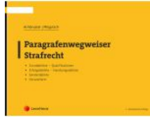
Paragrafenwegweiser Strafrecht Ladenpreis: 17,50EUR