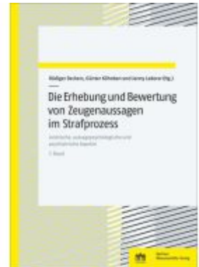
Die Erhebung und Bewertung von Zeugenaussagen im Strafprozess Ladenpreis: 35,00EUR