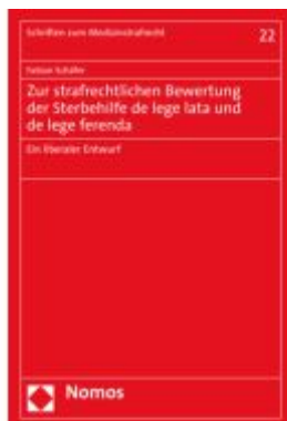
Zur strafrechtlichen Bewertung der Sterbehilfe de lege lata und de lege ferenda