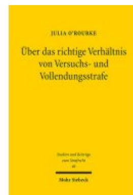
Über das richtige Verhältnis von Versuchs- und Vollendungsstrafe