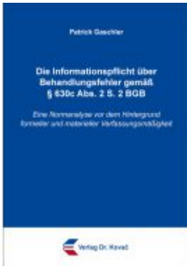
Die Informationspflicht über Behandlungsfehler gemäß § 630c Abs. 2 S. 2 BGB Ladenpreis: 88,30EUR