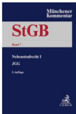
Münchener Kommentar zum Strafgesetzbuch Bd. 7: Nebenstrafrecht I Ladenpreis: 379,40EUR