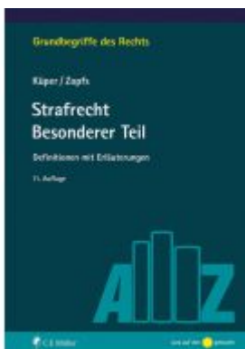
Strafrecht Besonderer Teil Ladenpreis: 30,90EUR