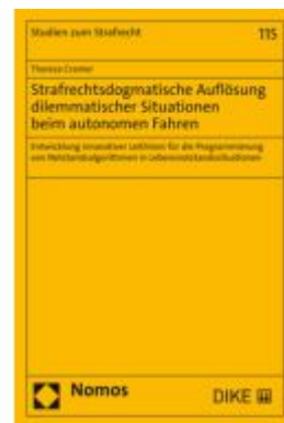
Strafrechtsdogmatische Auflösung dilemmatischer Situationen beim autonomen Fahren Ladenpreis: 86,40EUR