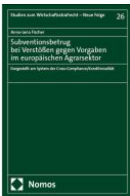
Subventionsbetrug bei Verstößen gegen Vorgaben im europäischen Agrarsektor Ladenpreis: 127,50EUR