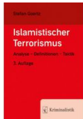
Islamistischer Terrorismus Ladenpreis: 30,90EUR