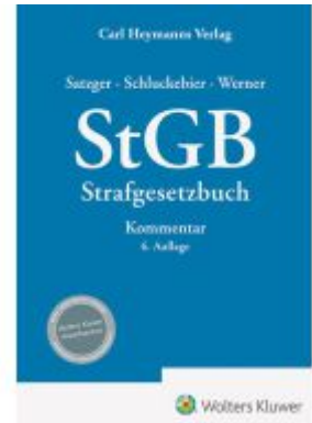
StGB Kommentar zum Strafgesetzbuch Ladenpreis: 194,30EUR