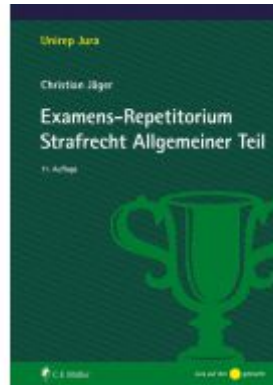
Examens-Repetitorium Strafrecht Allgemeiner Teil Ladenpreis: 28,80EUR