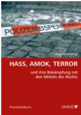
Hass, Amok, Terror und ihre Bekämpfung mit den Mitteln des Rechts Ladenpreis: 64,00EUR