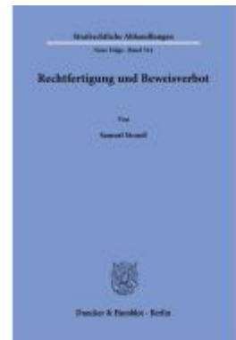
Rechtfertigung und Beweisverbot. Ladenpreis: 123,30EUR