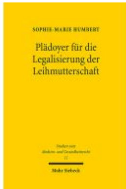
Plädoyer für die Legalisierung der Leihmutterschaft Ladenpreis: 107,00EUR