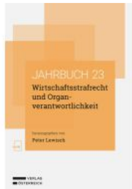
Wirtschaftsstrafrecht und Organverantwortlichkeit Ladenpreis: 74,00EUR