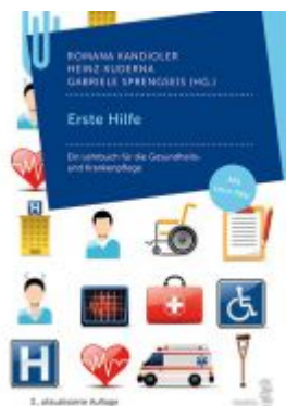
Erste Hilfe Ladenpreis: 24,90 EUR