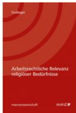
Arbeitsrechtliche Relevanz religiöser Bedürfnisse Ladenpreis: 74,00 EUR