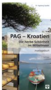
PAG - Kroatien Ladenpreis: 11,99 EUR