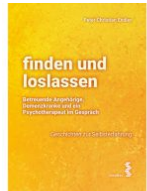
finden und loslassen Betreuende Angehörige, Demenzkranke und ein Psychotherapeut im Gespräch Ladenpreis: 16,90 EUR