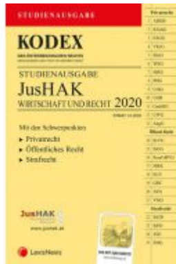
KODEX JusHAK Ladenpreis: 23,00 EUR