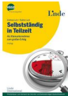
Selbstständig in Teilzeit Ladenpreis: 24,90 EUR