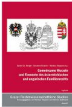
Gemeinsame Wurzeln und Elemente des österreichischen und ungarischen Familienrechts Ladenpreis: 34,90 EUR