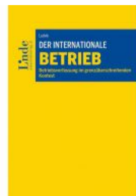
Der internationale Betrieb Ladenpreis: 89,00 EUR