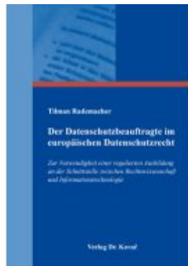
Der Datenschutzbeauftragte im europäischen Datenschutzrecht Ladenpreis: 101,60EUR