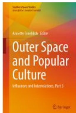
Outer Space and Popular Culture Ladenpreis: 153,99EUR