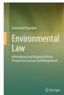
Environmental Law Ladenpreis: 219,99EUR