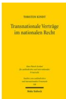
Transnationale Verträge im nationalen Recht Ladenpreis: 107,00EUR