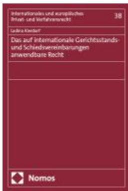
Das auf internationale Gerichtsstands- und Schiedsvereinbarungen anwendbare Recht Ladenpreis: 142,90EUR