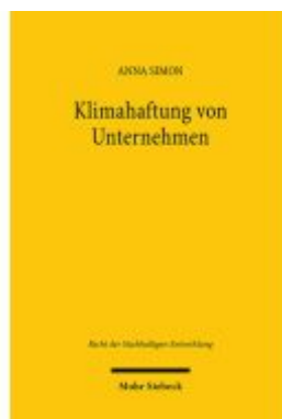
Klimahaftung von Unternehmen Ladenpreis: 71,00EUR