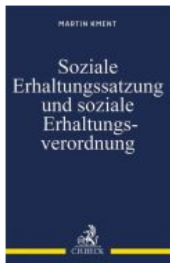
Soziale Erhaltungssatzung und soziale Erhaltungsverordnung Ladenpreis: 50,40EUR