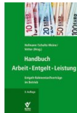
Handbuch Arbeit • Entgelt • Leistung Ladenpreis: 50,40EUR