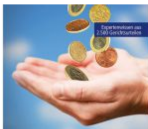
100 Steuer-Tipps Wie Angestellte und Pensionisten sparen können Kapitalerträge, Verrentung und Verpöchtung, Arbeitnehmerverrentung und Steuerbefreiung