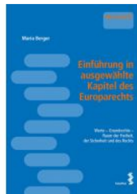
Einführung in ausgewählte Kapitel des Europarechts Ladenpreis: 16,00 EUR