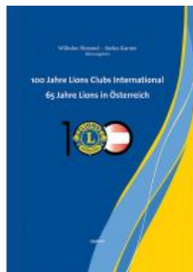
100 Jahre Lions Clubs International. 65 Jahre Lions in Österreich Ladenpreis: 29,90 EUR