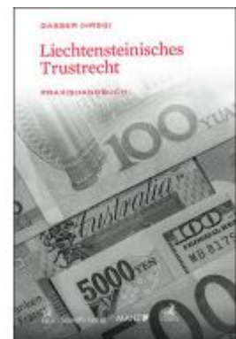
Liechtensteinisches Trustrecht Ladenpreis: 99,00 EUR