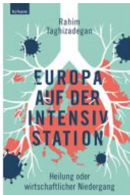
Europa auf der Intensivstation Ladenpreis: 22,50 EUR

Wir haben andere Produkte gefunden, die Ihnen gefallen könnten!