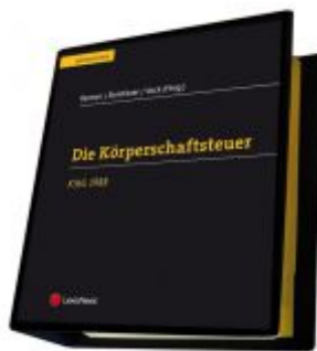
Die Körperschaftsteuer (KStG 1988) Ladenpreis: 372,00 EUR