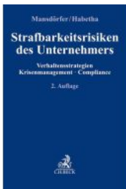
Strafbarkeitsrisiken des Unternehmers Ladenpreis: 71,00EUR