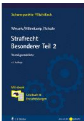
Strafrecht Besonderer Teil 2 Ladenpreis: 28,80EUR