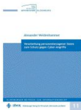
Verarbeitung personenbezogener Daten zum Schutz gegen Cyber-Angriffe Ladenpreis: 41,00EUR