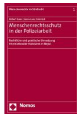
Menschenrechtsschutz in der Polizeiarbeit Ladenpreis: 127,50EUR