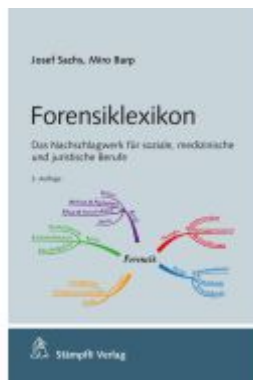
Forensiklexikon Ladenpreis: 51,90EUR