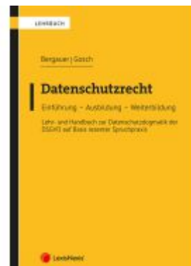
Datenschutzrecht Ladenpreis: 86,00EUR