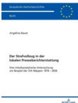
Der Strafvollzug in der lokalen Presseberichterstattung Ladenpreis: 56,50EUR