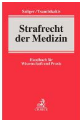
Strafrecht der Medizin Ladenpreis: 173,80EUR