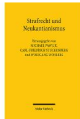
Strafrecht und Neukantianismus Ladenpreis: 122,40EUR