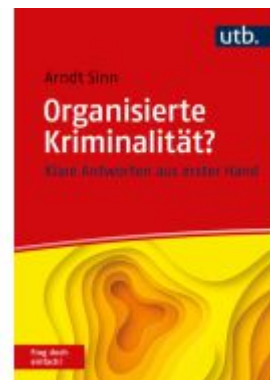
Organisierte Kriminalität? Frag doch einfach! Ladenpreis: 20,50EUR