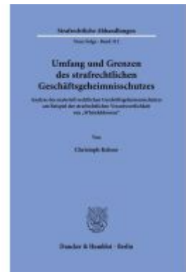
Umfang und Grenzen des strafrechtlichen Geschäftsgeheimnisschutzes. Ladenpreis: 102,70EUR