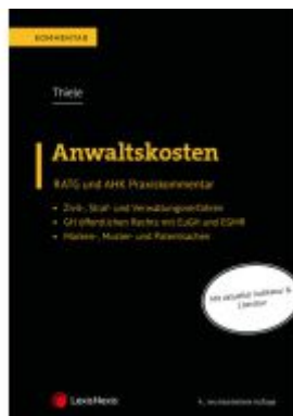
Anwaltskosten Ladenpreis: 139,00EUR