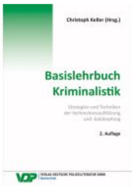
Basislehrbuch Kriminalistik Ladenpreis: 45,30EUR

Wir haben andere Produkte gefunden, die Ihnen gefallen könnten!