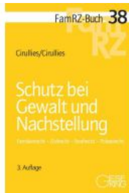
Schutz bei Gewalt und Nachstellung Ladenpreis: 71,00EUR