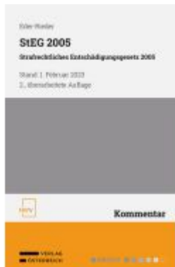
StEG 2005 Strafrechtliches Entschädigungsgesetz 2005 Ladenpreis: 58,00EUR

Wir haben andere Produkte gefunden, die Ihnen gefallen könnten!