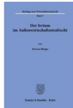
Der Irrtum im Außenwirtschaftsstrafrecht. Ladenpreis: 92,50EUR