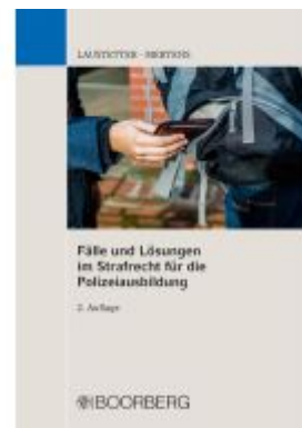
Fälle und Lösungen im Strafrecht für die Polizeiausbildung Ladenpreis: 27,60EUR