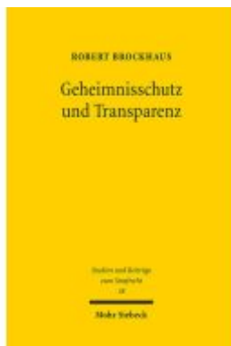
Geheimnisschutz und Transparenz Ladenpreis: 117,20EUR