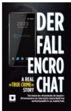
Der Fall EncroChat - A Real »True Crime« Story Ladenpreis: 32,00EUR