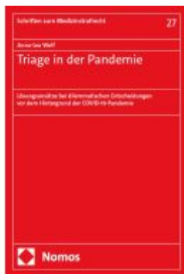
Triage in der Pandemie Ladenpreis: 117,20EUR