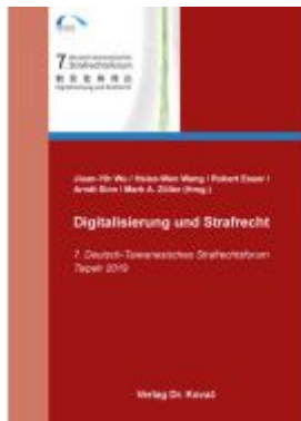
Digitalisierung und Strafrecht Ladenpreis: 81,10EUR