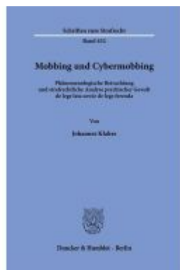
Mobbing und Cybermobbing Ladenpreis: 92,50EUR