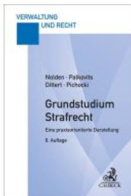
Grundstudium Strafrecht Ladenpreis: 26,70EUR