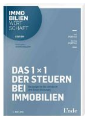
Das 1 x 1 der Steuern bei Immobilien Ladenpreis: 39,00EUR