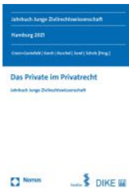
Das Private im Privatrecht Ladenpreis: 81,30EUR