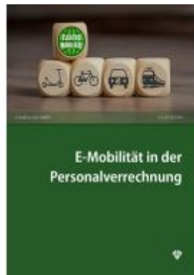
E-Mobilität in der Personalverrechnung Ladenpreis: 25,00EUR