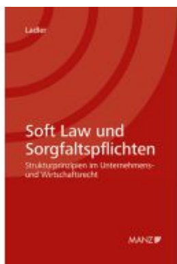
Soft Law und Sorgfaltspflichten Strukturprinzipien im Unternehmens- und Wirtschaftsrecht Ladenpreis: 98,00EUR