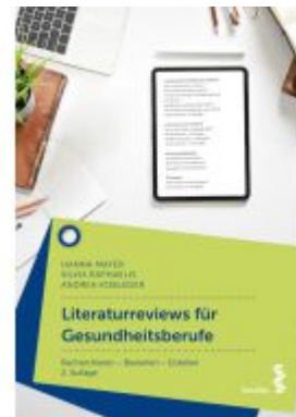
Literaturreviews für Gesundheitsberufe Ladenpreis: 28,90EUR