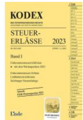
KODEX Steuer-Erlässe 2023, Band I Ladenpreis: 62,00EUR