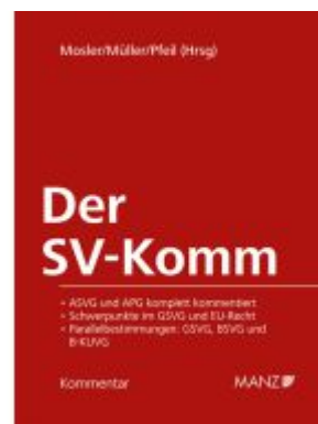
Der SV-Komm Ladenpreis: 398,00EUR