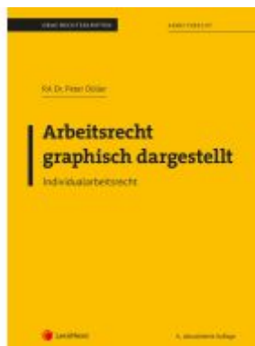
Arbeitsrecht graphisch dargestellt Ladenpreis: 26,25EUR