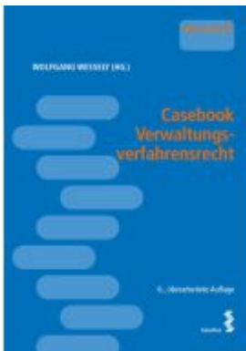
Casebook Verwaltungsverfahrenrecht Ladenpreis: 34,00EUR