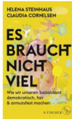
Es braucht nicht viel Ladenpreis: 24,70EUR