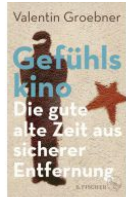
Gefühlskino Ladenpreis: 24,70EUR