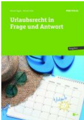
Urlaubsrecht in Frage und Antwort Ladenpreis: 36,00EUR