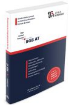
BGB AT Ladenpreis: 29,80EUR