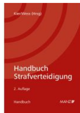
Handbuch Strafverteidigung Ladenpreis: 164,00EUR