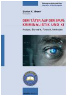
Dem Täter auf der Spur: Kriminalistik und KI Ladenpreis: 30,90EUR