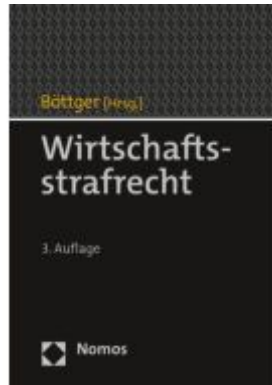
Wirtschaftsstrafrecht Ladenpreis: 184,10EUR