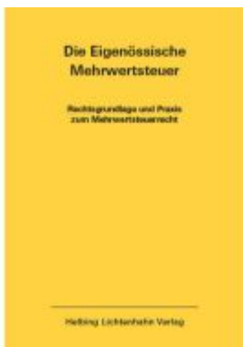
Die Eidgenössische Mehrwertsteuer EL 49 Ladenpreis: 152,00EUR

Wir haben andere Produkte gefunden, die Ihnen gefallen könnten!