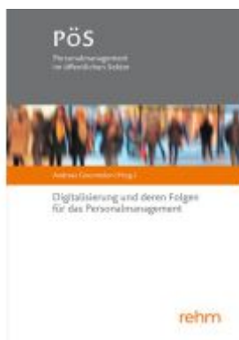
Digitalisierung und deren Folgen für das Personalmanagement Ladenpreis: 30,90EUR