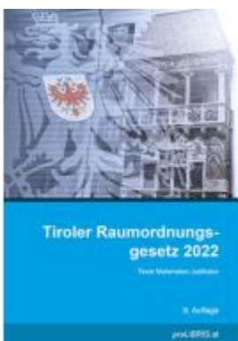
Tiroler Raumordnungsgesetz 2022 Ladenpreis: 33,00EUR